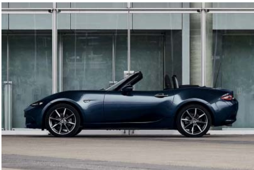
Mazda MX-5 ST Sélection avec option peinture Mica Deep Crystal Blue.