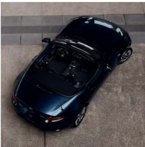
Mazda MX-5 ST 2.0L Sélection BVM avec option peinture Mica Deep Crystal Blue.