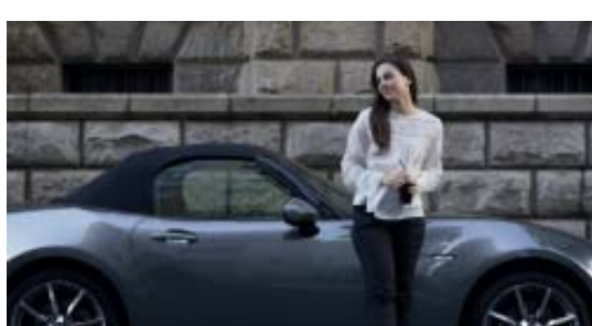
MX-5 ST Toit souple couleur noire