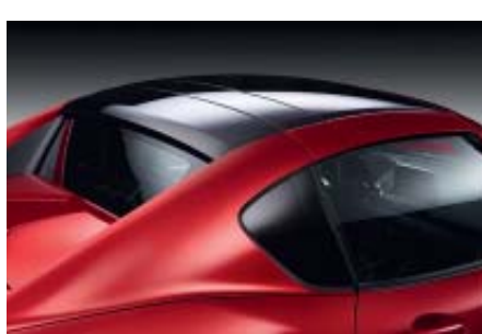
MX-5 RF Toit bi-ton optionnel (disponible sur MX-5 RF BVM)